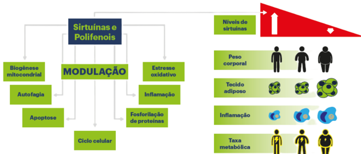
Figura 1. Benefícios da modulação/ativação de sirtuínas no organismo

SIRTCONTROL® é um fitoativo exclusivo composto por Polygonum cuspidatum , Elettaria cardamomum e Olea europaea com padronização em 2% de resveratrol, 2% de quercetina, 2% de luteolina e 2% de polifenóis, bioativos que podem ativar e modular as sirtuínas, indicado para atuar no emagrecimento, redução da gordura abdominal e inflamação crônica, além da melhora do perfil lipídico e níveis de glicose.