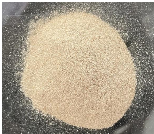
Figura 04: Produto final.

O fechamento da embalagem foi verificado e está livre de qualquer vazamento? (x)Sim ( )Não