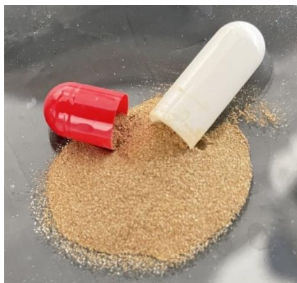
Figura 02: Produto final.