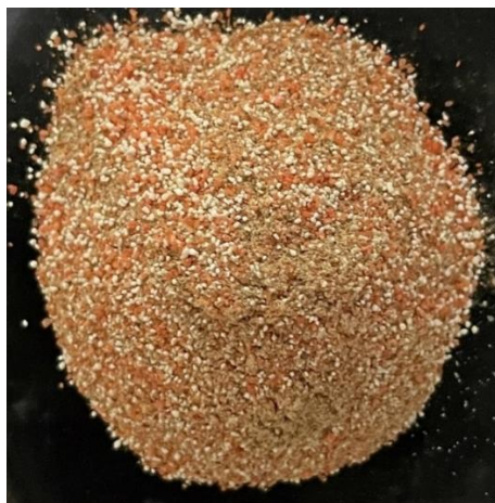
Figura 05: Produto final.